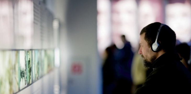
Επισκέπτες με ηχητική ξενάγηση στο Κέντρο Πληροφόρησης