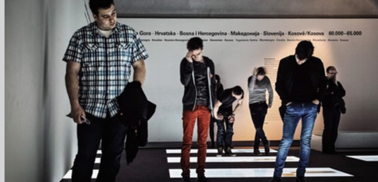
1 · Αίθουσα των Διαστάσεων