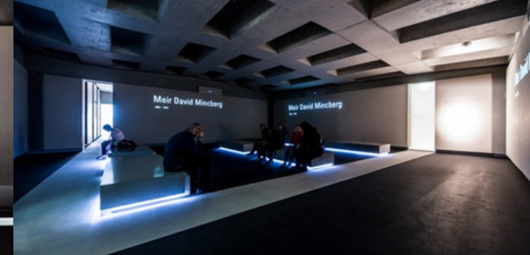
3 · Αίθουσα των Ονομάτων